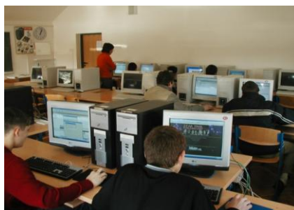
Slika 3. Specijalizirana učionica