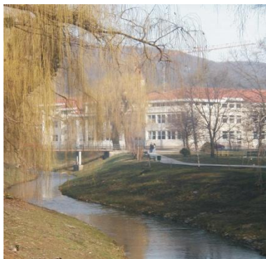
Slika 1. Srednja škola Krapina

Srednja škola Krapina smještena je u središtu grada Krapine, u gradskom parku.