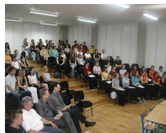
Slika 5. Dvorana za priredbe

U dvorani za priredbe organiziraju se književne večeri, koncerti, priredbe, susreti povodom obilježavanja značajnih datuma.