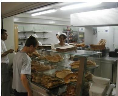
Slika 4. Školska kantina

Dogradnjom novog dijela školske zgrade, Srednja škola Krapina dobila je na uporabu školsku kantu. Svojom veličinom i opremljenošću zadovoljava potrebe učenika i djelatnika škole.