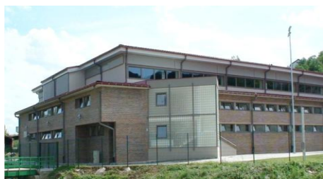
Slika 7. Sportska dvorana

Krajem kolovoza 2007. otvorena je nova školska sportska dvorana – trodijelna, veličine 2.500 m 2 , sa 700 sjedećih mjesta i pripadajućim vanjskim terenima.