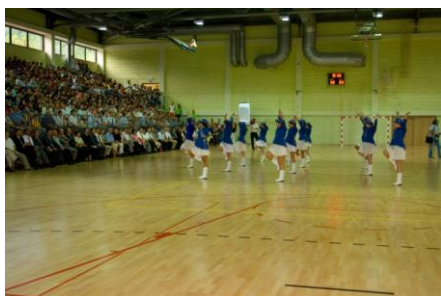
Slika 2. Sportska dvorana